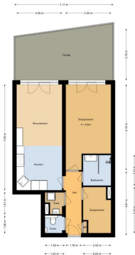
Appartement Coremolen 5M17 Noordwijkerhout