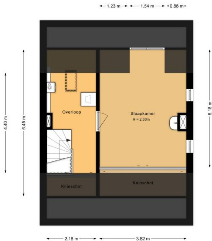
Tweede verdieping Hoogduinweg 56 De Zilk