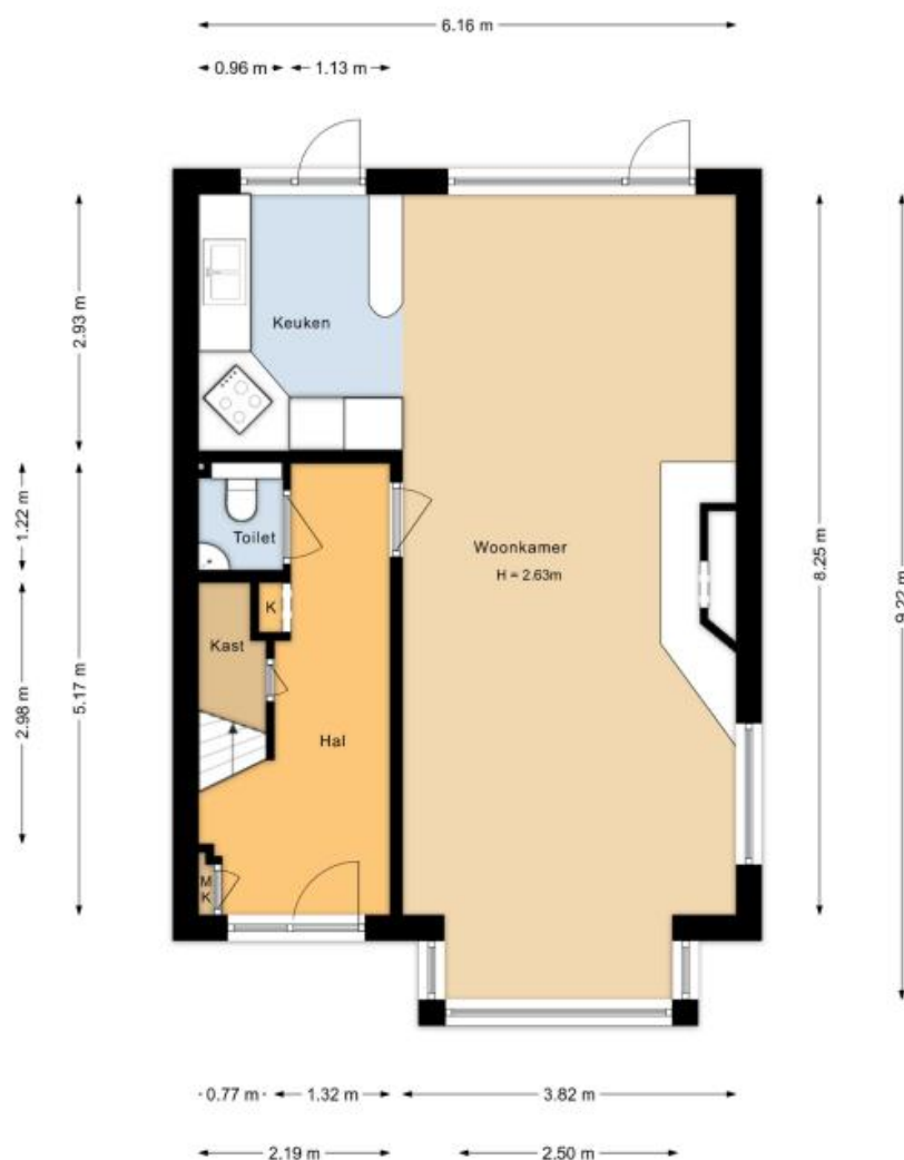
Begane grond Hoogduinweg 56 De Zilk