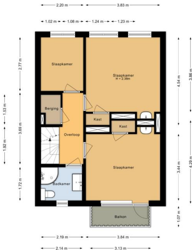
Eerste verdieping Hoogduinweg 56 De Zilk