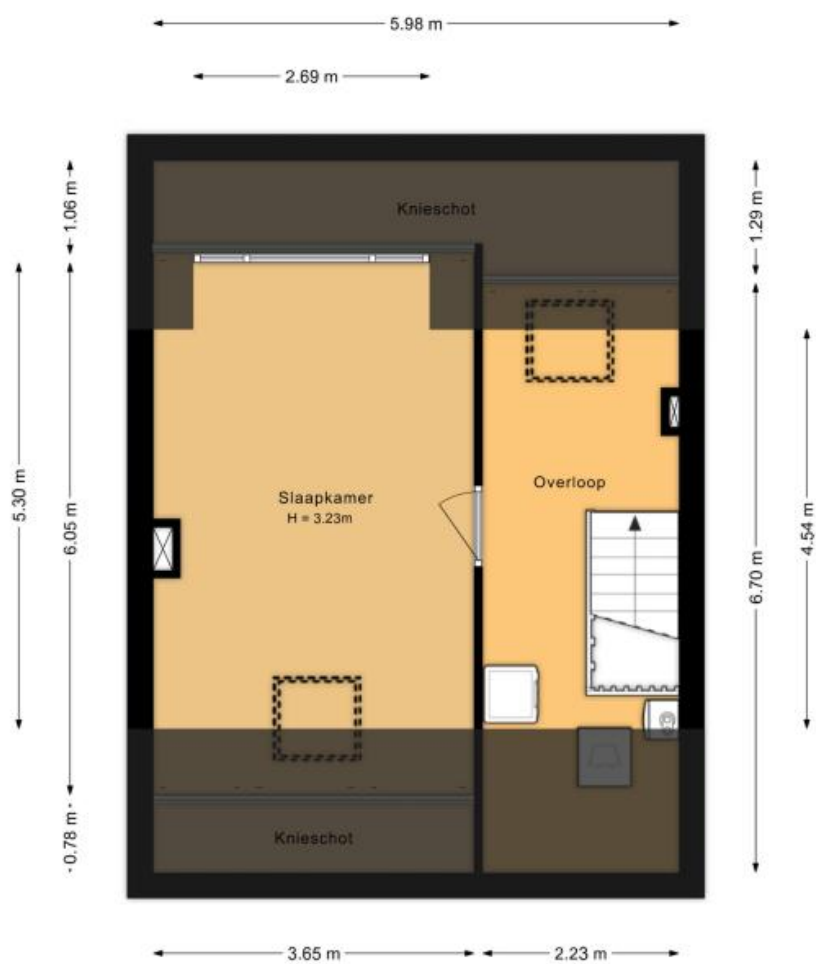
Tweede verdieping Frans Halsstraat 59 Lisse