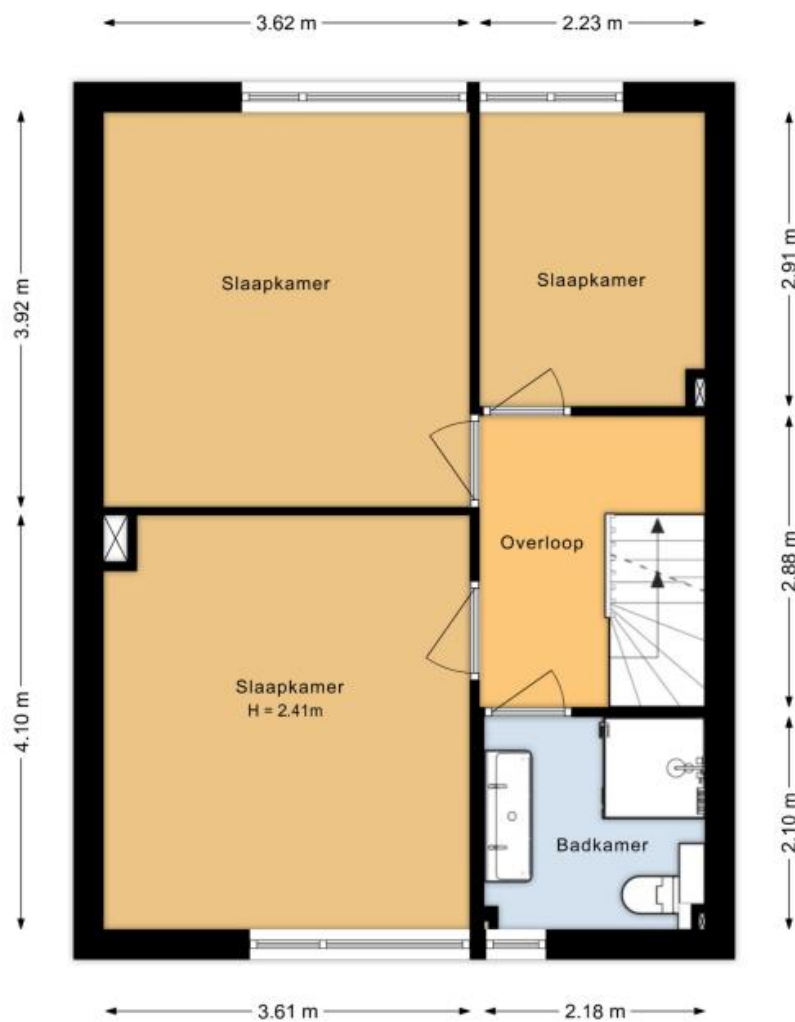
Eerste verdieping Frans Halsstraat 59 Lisse