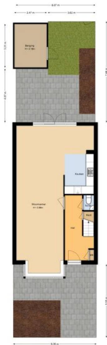
Situatie Frans Halsstraat 59 Lisse